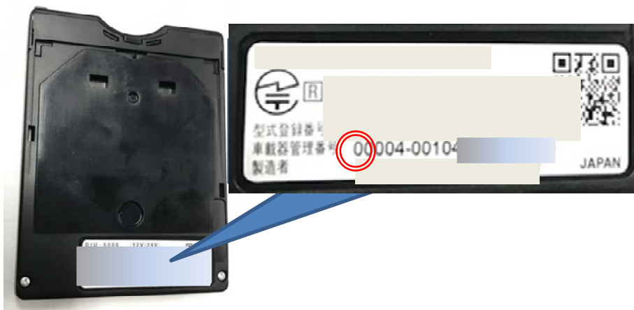
(写真): 旧セキュリティ対応車載器